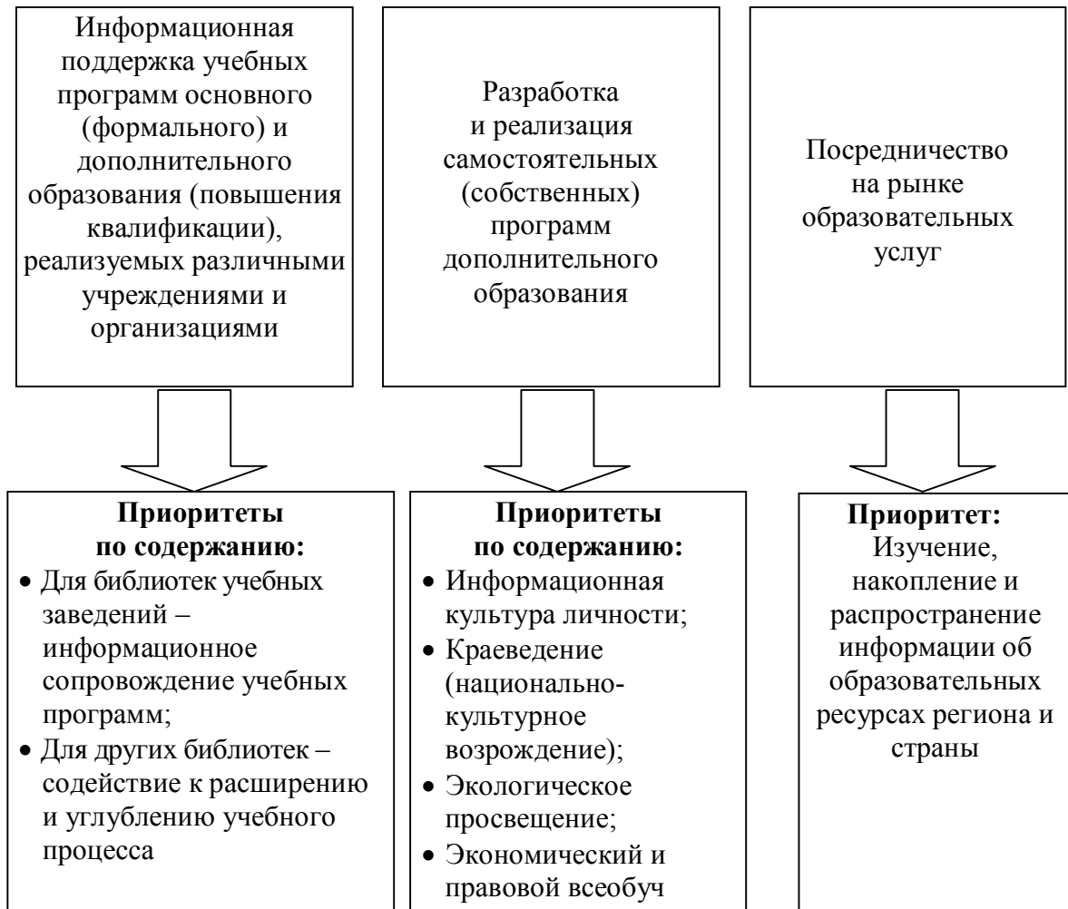
Рисунок 2 – Возможности школьных библиотек по совершенствованию обслуживания читателей

к своим героям, заняв и в их жизни свое место, определить, таким образом, реальные ориентиры и для своей сегодняшней жизни. В этом процессе общения с библиотекарем, с авторами книг и их героями, человек самореализуется и развивается как личность [226].