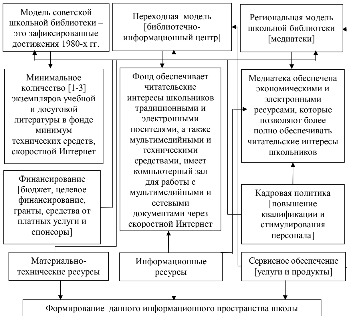
Рисунок 3 – Характеристика моделей современных школьных библиотек